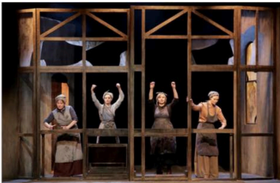
Programmé Aux Actes Citoyens de l'édition 2021

Malgré la douloureuse série des reports et annulations infligée au monde de la culture depuis mars 2020, le festival Aux Actes Citoyens n'a rien perdu de ses enthousiasmes. Et du 25 septembre au 2 octobre, Tomblaine tient à fêter le 30 e anniversaire de son festival avec panache.