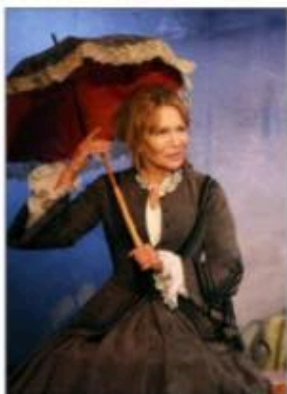
Le classique passera par la voix de Clémentine Célarié et les textes de Maupassant.