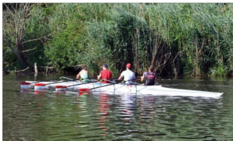
On croise de nombreux rameurs au fil de la Meurthe.