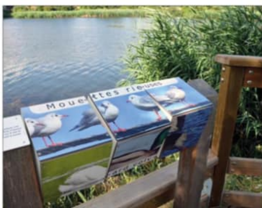
Des cubes tournants pour apprendre en s'amusant.

Ses habitats humides variés (boisements, roselières, noues) hébergent une flore et